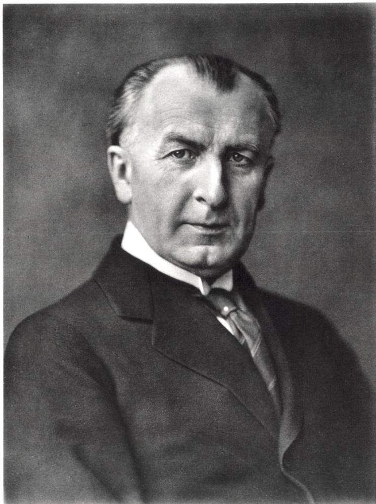
LAURBERG & GAD FOT. 1928.